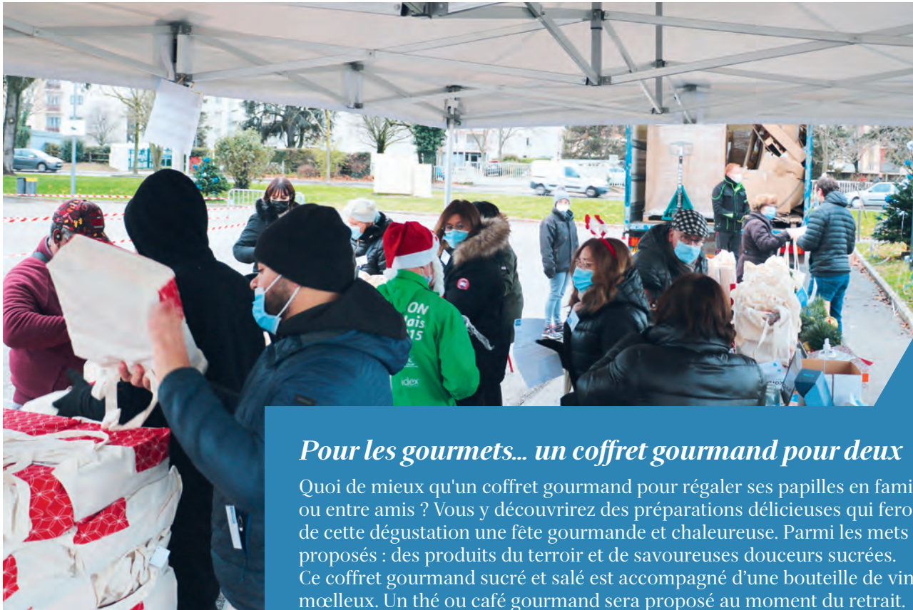
L'an dernier, lors de la distribution des coffrets gourmands.