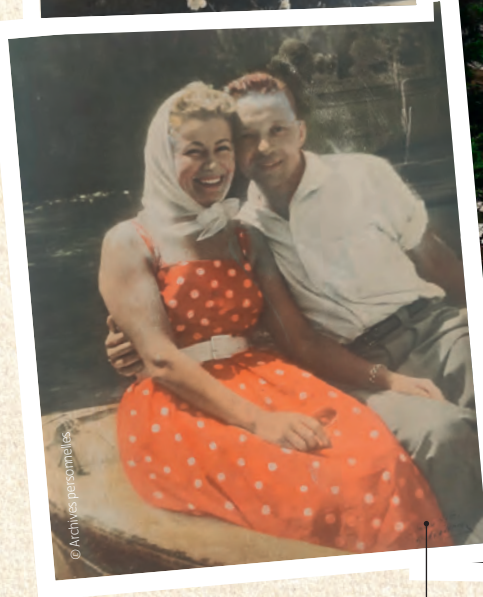
Le jeune couple en voyage en Italie, vers 1960.