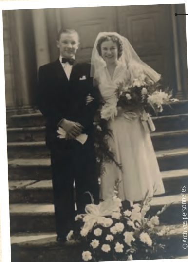
À gauche : le jour du mariage sur le parvis de l'église du village. 1949.

D'un point de vue architectural, la villa est de style dit « paquebot ». Elle a été réalisée par l'architecte Merlin, qui sera aussi à l'origine de l'entrepôt et d'autres maisons dans Saint-Priest. Elle se composait de trois parties : un corps principal de deux niveaux sur rez-de-chaussée, une aile droite surmontée d'une terrasse et formant un « bow window », et une terrasse à l'avant de la maison comportant une volée d'escalier. Au rez-de-chaussée se trouvait un appartement, celui de sa fille Patricia ; à l'étage, les pièces à vivre avec une salle à manger, un salon, un bureau, une cuisine et un couloir avec une terrasse où se situait l'entrée originelle. Au 2 e étage se trouvaient les chambres avec une salle de bain et une terrasse. Une