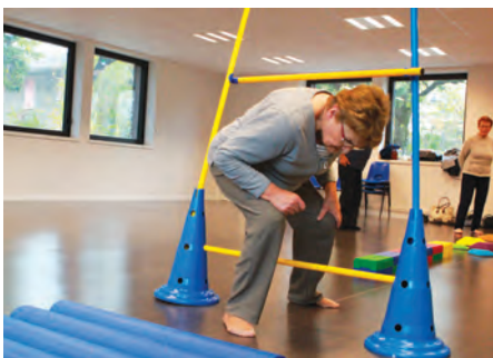
La commission s'assure notamment que les activités proposées aux seniors sont bien adaptées.

Faire part au CCAS du retour d'expérience des participants aux activités proposées par les différentes structures et associations de la ville et de leurs souhaits et suggestions, pour qu'il se rapproche à son tour des structures et associations afin que celles-ci répondent au mieux aux besoins exprimés : tel était l'objectif de la commission Loisirs du CCAS au moment de sa création, en 2018. Devenue « commission Bien vieillir à Saint-Priest » le 22 mai dernier, celle-ci entend désormais embrasser un champ plus large que les seules activités et loisirs. Espaces verts et bâtiments, transports et mobilité, autonomie, habitat, lien social et solidarité, emploi ou encore écologie... c'est désormais sur une multitude de