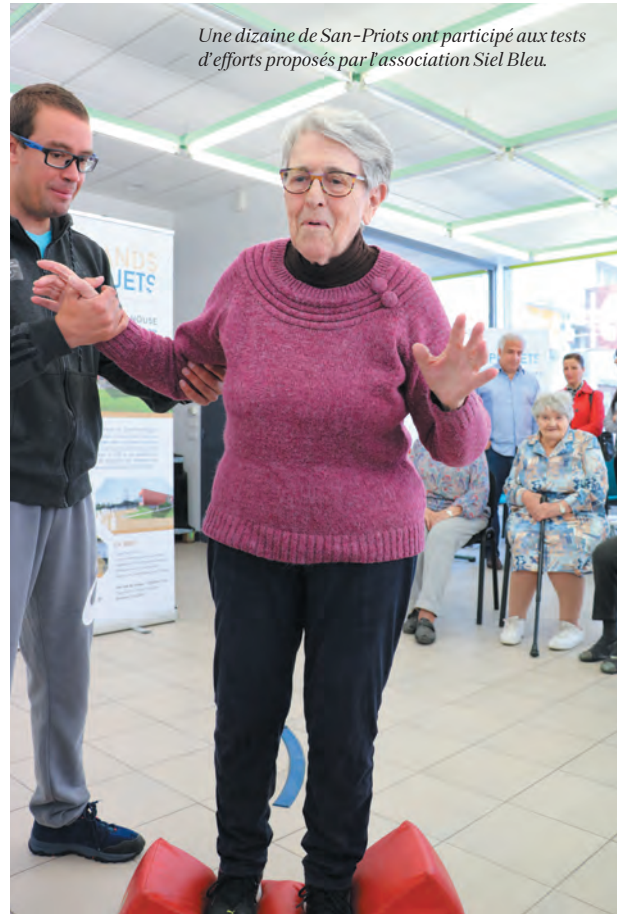
Une dizaine de San-Priots ont participé aux tests d'efforts proposés par l'association Siel Bleu.