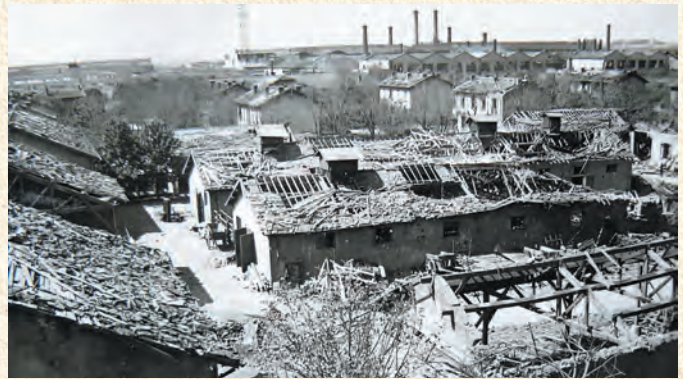
La Ferme Berliet vers 1961.