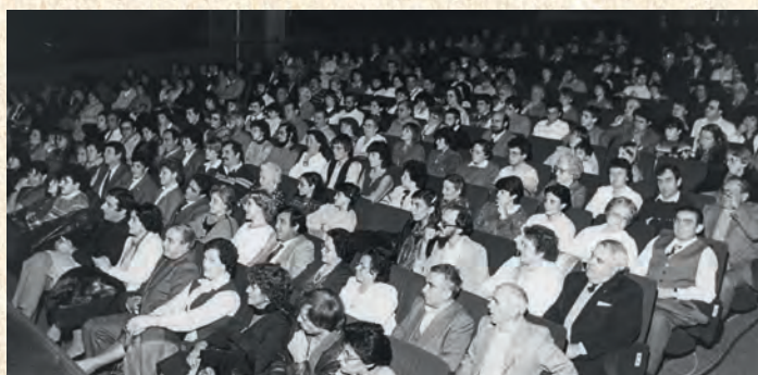
Inauguration de la nouvelle salle de spectacle, mars 1981.