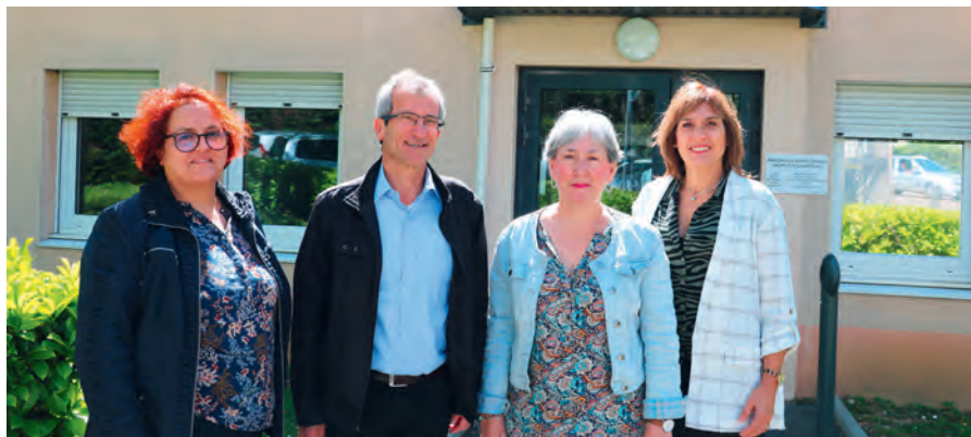
L'équipe san-priote de France Bénévolat.

À partir du 16 septembre 2019, permanences les 1 er et 3 e lundis du mois de 15 h à 19 h à la Maison des associations – 2, rue de la Cordière.