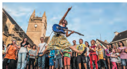
La Chorale Public de la Cie Label Z, c'est le vendredi 4 octobre à la ferme Berliet.

Retrouvez tous les détails de la grille tarifaire sur le site du théâtre : www.theatretheoargence-saint-priest.fr