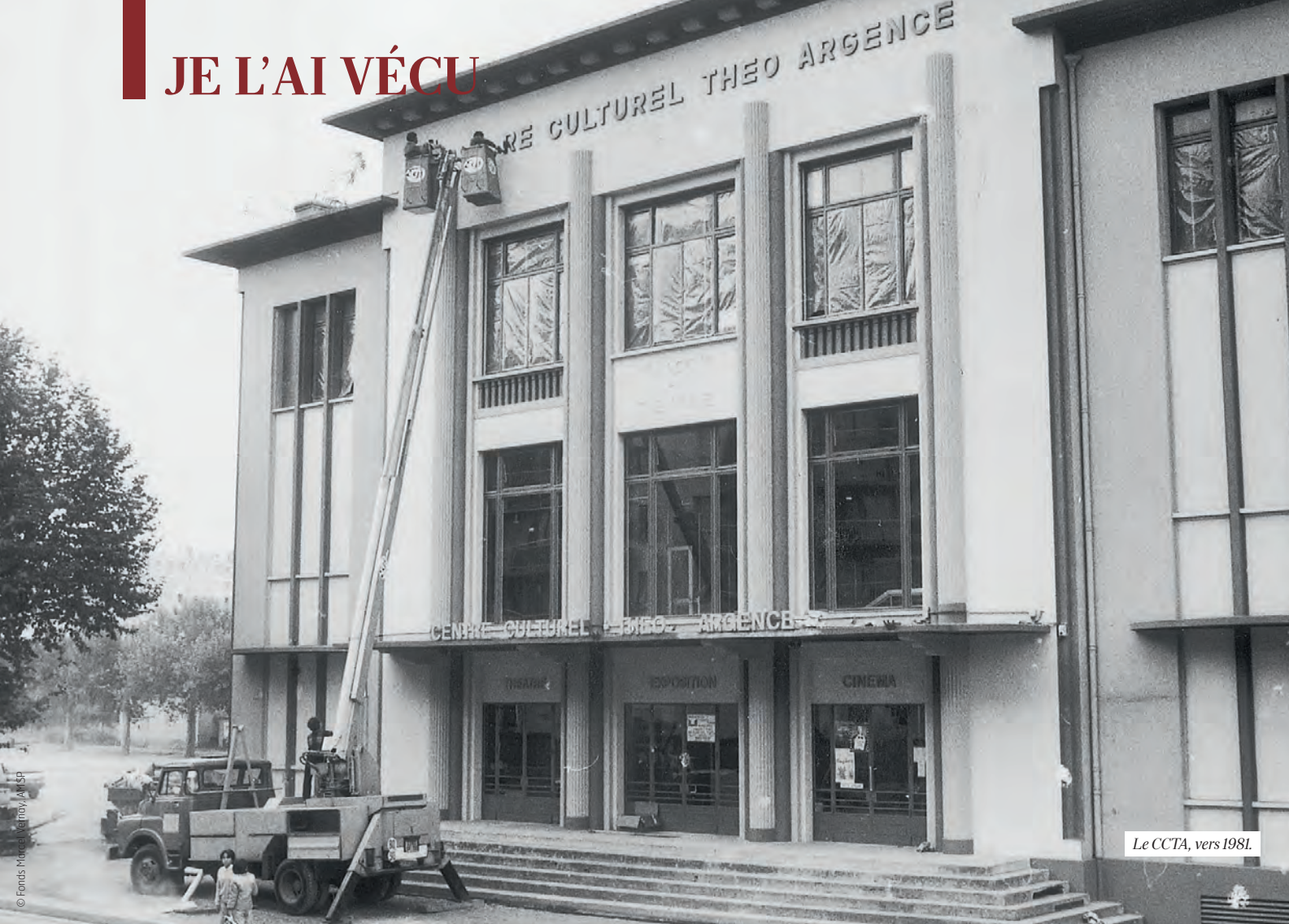
Le CCTA, vers 1981.