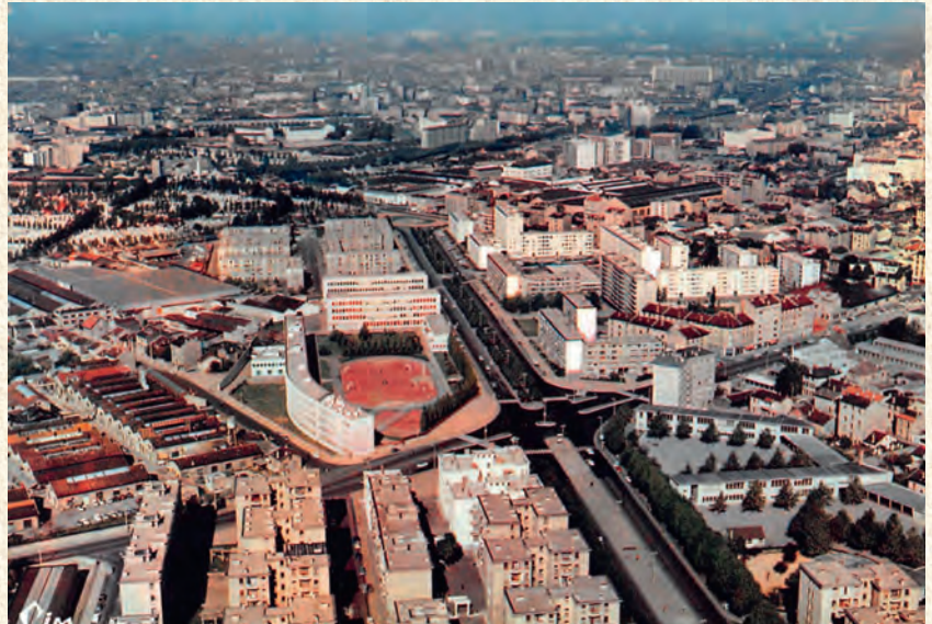
Le quartier des États Unis à Lyon vers 1970.

Depuis, de nouvelles balades ont vu le jour : en 2017, « la Médiathèque au cœur du Centre-ville », en 2018, en collaboration