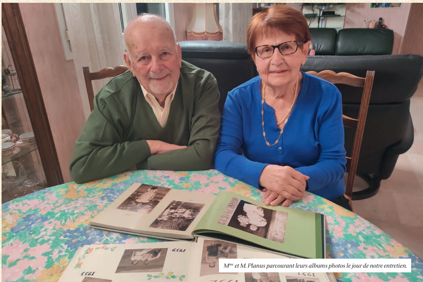
M me et M. Planus parcourant leurs albums photos le jour de notre entretien.