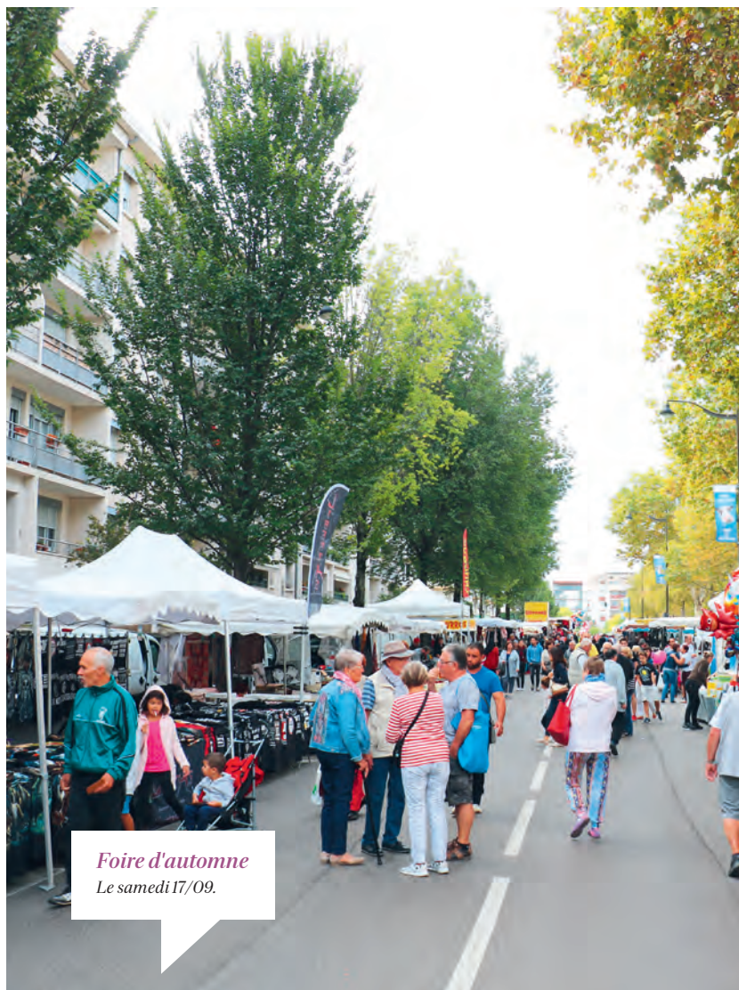
Foire d'automne Le samedi 17/09.