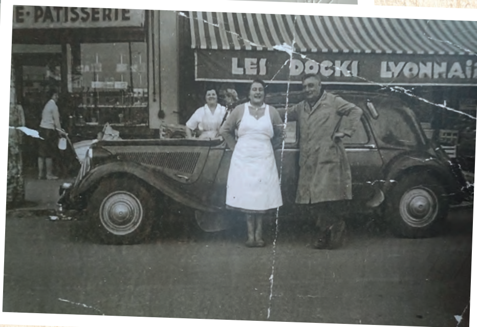
..... Les parents de M. Vigne devant leur magasin avenue de la gare, début 1960 (archive personnelle). ▼

propose un poste de conducteur de travaux à Gerland. Il y restera près de 15 ans avant de devenir chef d'agence. Une belle carrière durant laquelle il réalisera de nombreux projets, dont la piste d'essai de la Valbonne, ou encore le tramway de Perrache.