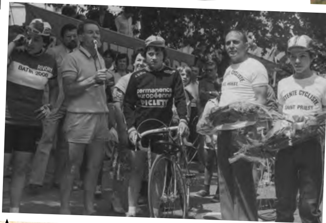
Interview des vainqueurs du Grand prix cycliste de Saint-Priest.