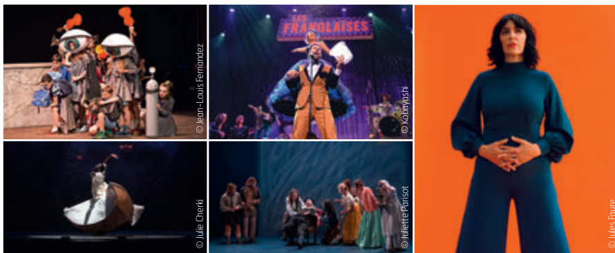
De gauche à droite et de haut en bas : Brundibâr, par l'Opéra national de Lyon / Les Franglaises / La Grande Sophie / Folia, par Mourad Merzouki / L'avare de Molière, par la compagnie Jérôme Deschamps.

Et que dire de la programmation proposée par les équipes du TTA pour cette saison 2023-2024, si ce n'est qu'elle est à l'image du théâtre lui-même : magnifique. Théâtre bien sûr, mais aussi danse, chanson, magie, cirque, spectacles jeune public, il y en aura pour tous les goûts, pour toutes les San-Priotes et tous les San-Priots. La saison débute ainsi avec l'enfant chéri de la ville, Mourad Merzouki, qui vient présenter 4 soirs de suite