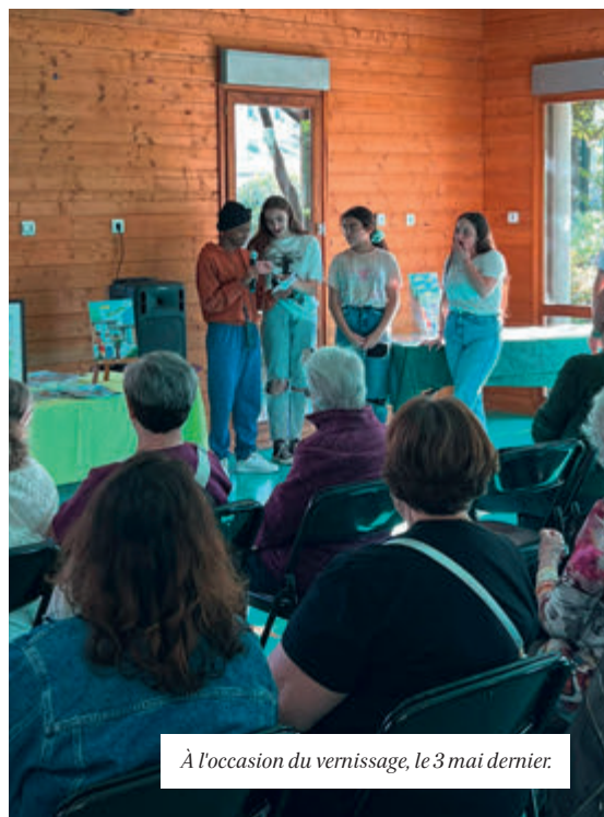
À l'occasion du vernissage, le 3 mai dernier.

Nous et notre planète constitue une sorte d'ovni littéraire. Le document rassemble en effet les deux BD primées et des propositions de gestes simples pour réduire cette pollution par les déchets, mais aussi de nouvelles planches, réalisées par les seniors et les jeunes impliqués, ainsi qu'une série de textes et poèmes proposés par les seniors des groupes «Écriture» et «Lundi Détente» du centre social. Des textes qui mettent en exergue les menaces croissantes qui affectent notre environnement, notre bien commun, et plus globalement notre planète. « On peut souhaiter que cette collaboration intergénérationnelle se poursuive entre les divers groupes du centre social. Les sujets ne manquent pas face à