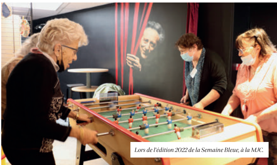
Lors de l'édition 2022 de la Semaine Bleue, à la MJC.

Pour découvrir l'histoire de la ville , rendez-vous à la médiathèque dès 10h jeudi 5 octobre : en effet, la médiathèque propose une bibliothèque vivante où les personnes font office de livres en partageant des anecdotes. Et si vous avez des questions relatives à votre santé ou à celle de vos proches, le Bus Info Santé de la métropole de Lyon vous