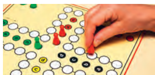
DOC RABE Media

Jeux de cartes, jeux de sociétés, projection vidéo... Proposé par l'ACS Berliet.