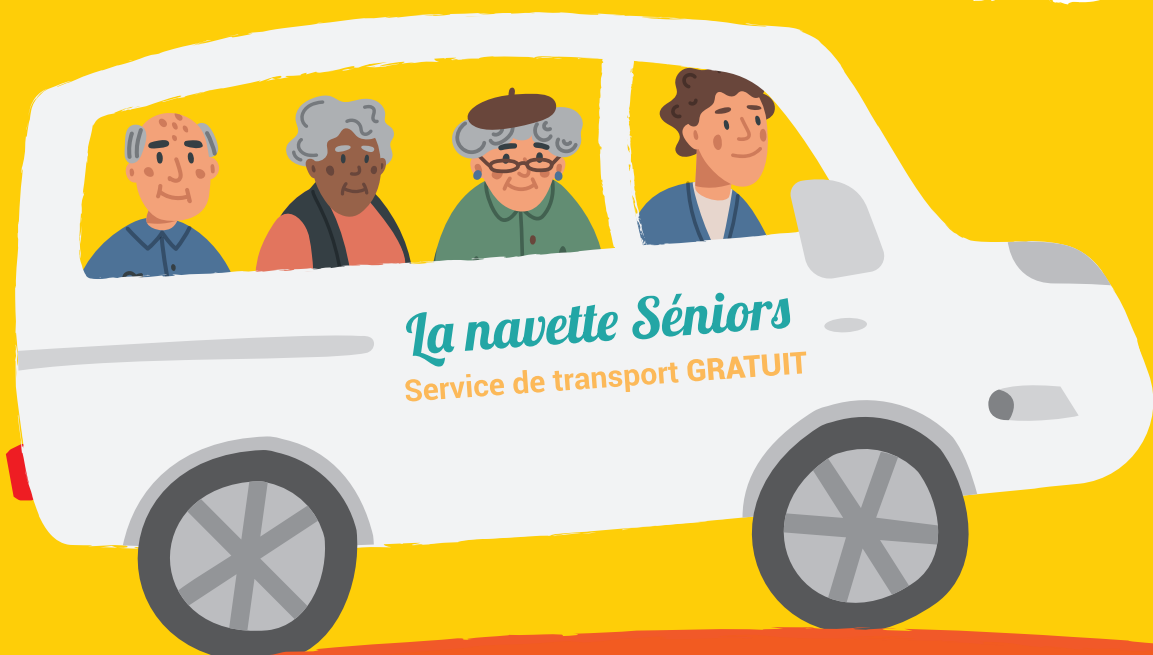
Illustration personnages : © ms point

Service de transport GRATUIT pour les plus de 65 ans à Saint-Priest.