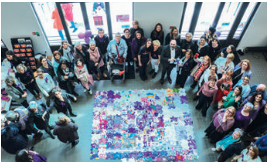
Le puzzle a été assemblé au Théâtre Théo Argence le 8 mars dernier, lors de la Journée des droits des femmes.

Samedi 8 mars, tous se sont retrouvés au Théâtre Théo Argence pour assembler les 250 pièces réalisées par 30 structures différentes afin de créer une œuvre collective. L'événement a attiré plus de 300 personnes autour de nombreuses animations organisées pour l'occasion par le CCAS et ses partenaires. //