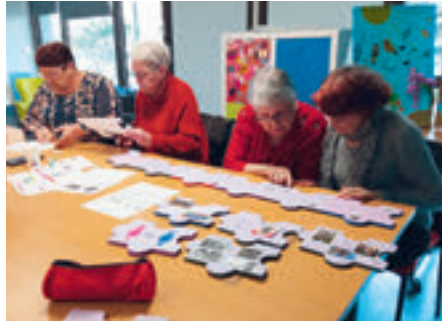
Les participants à l'atelier ont créé un message pour chaque pièce du puzzle.

Ce moment d'échange intergénérationnel a renforcé les liens entre les participants et a permis de sensibiliser