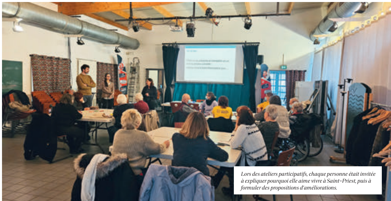
Lors des ateliers participatifs, chaque personne était invitée à expliquer pourquoi elle aime vivre à Saint-Priest, puis à formuler des propositions d'améliorations.

Des ateliers participatifs ont été mis en place afin de recueillir les besoins des personnes âgées.